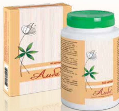
капсулы №60 и №365

первый стандартизированный фитопрепарат, содержащий лечебную дозу экстракта корня лапчатки белой 300 мг, патогенетическая активность которого подтверждена многоцентровыми клиническими исследованиями